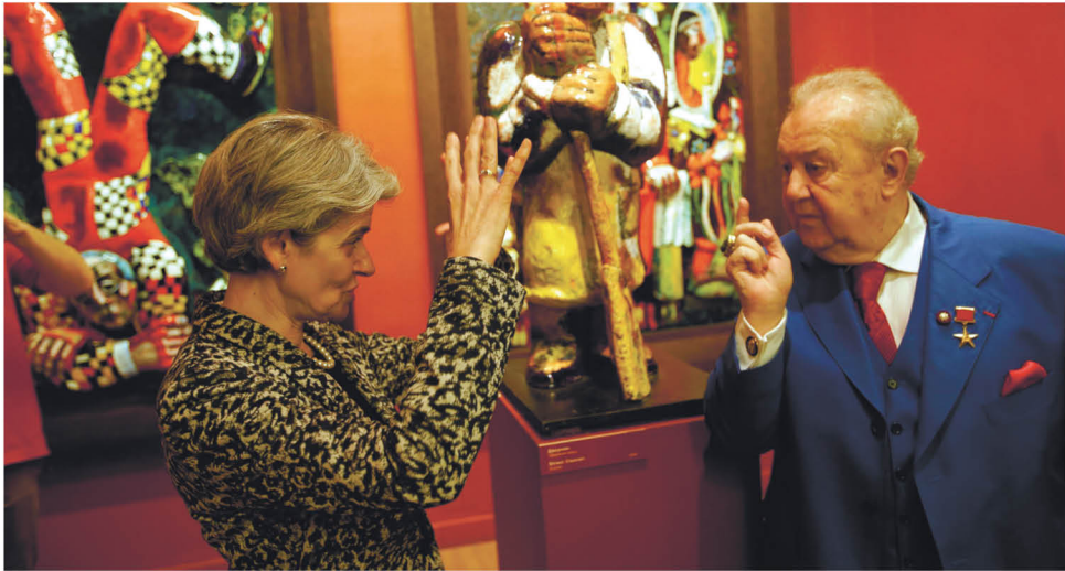
З. Церетели знакомит Генсека ЮНЕСКО И. Бокову с постоянной экспозицией музея

С 10 по 12 мая в залах музейно-выставочного комплекса «Галерея искусств» Российской академии художеств (РАХ) проходил Международный форум «Мировая культура как ресурс устойчивого развития». Организаторами форума стали Российская академия художеств и Международная кафедра изобразительного искусства и архитектуры ЮНЕСКО.