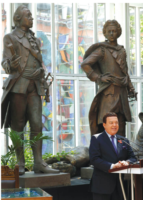
Выступает Иосиф Кобзон