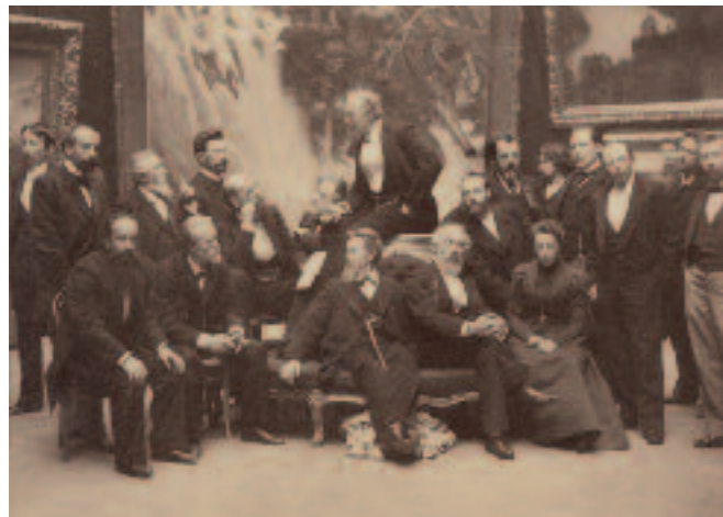
И.И.Левитан (стоит второй слева) в группе художников ТПХВ Фотография. 1899

Isaac Levitan (standing second left) in a group of artists at MSAL Photo. 1899