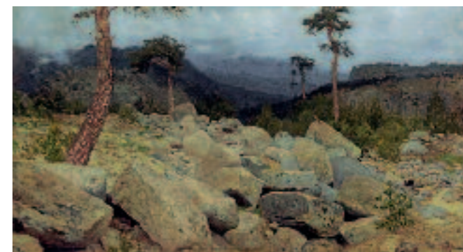
И.И.ЛЕВИТАН Крым. В горах . 1886 Неоконченный этюд Бумага на холсте, масло. 20 × 23,4 ГТГ