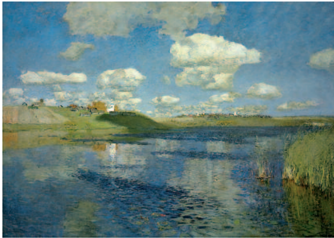
И.И.ЛЕВИТАН Озеро. 1899–1900 Холст, масло 149 × 208 ГРМ

Isaac LEVITAN Lake. 1899–1900 Oil on canvas 149 × 208 cm Russian Museum