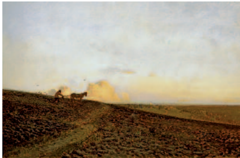
И.И.ЛЕВИТАН Вечер на пашне . 1883 Холст, масло 43,3 × 67 ГТГ