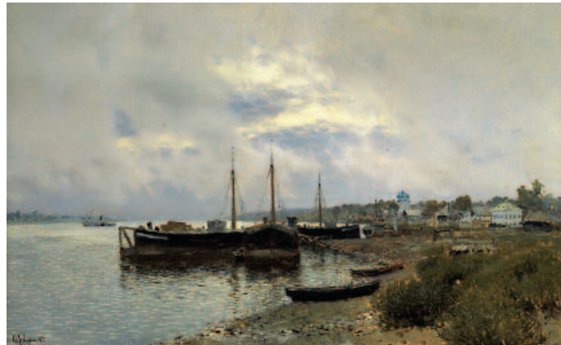
И.И.ЛЕВИТАН После дождя. Плѣс. 1889 Холст, масло 80 × 125 ГТГ

Isaac LEVITAN Vladimirka Road. 1892 Oil on canvas 79 × 123 cm Tretyakov Gallery