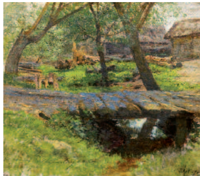
И.И.ЛЕВИТАН Мостик. Саввинская слобода . 1884 Этюд Холст, масло. 25 × 29 ГТГ