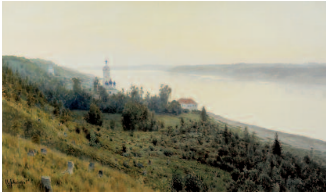
И.И.ЛЕВИТАН Вечер. Золотой Плѣс. 1889 Холст, масло 84,2 × 142 ГТГ

Isaac LEVITAN Evening. Golden Plyos. 1889 Oil on canvas 84.2 × 142 cm Tretyakov Gallery