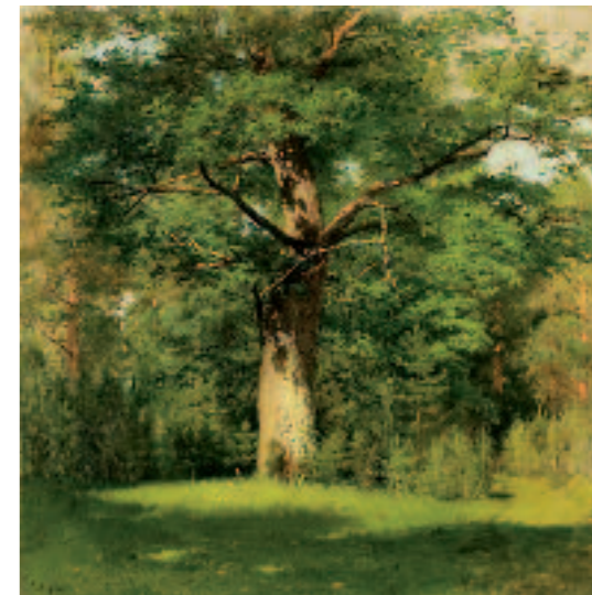
И.И.ЛЕВИТАН Аллея. Останкино . Начало 1880-х Холст на картоне, масло 54,3 × 43,6 ГТГ