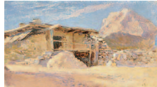
▼ Isaac LEVITAN Saklya in Alupka . 1886 Study Oil on paper mounted on cardboard 19.5 × 33 cm Tretyakov Gallery