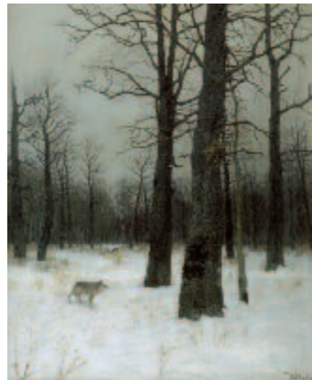
Isaac LEVITAN Winter. In a Forest . 1885 Oil on canvas 55 × 45 cm Tretyakov Gallery