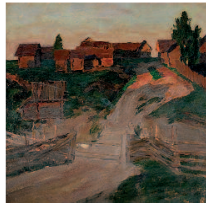
И.И.ЛЕВИТАН Весна – большая вода. 1897 Холст, масло 64,2 × 57,5 ГТГ

Isaac LEVITAN Spring Flood. 1897 Oil on canvas 64.2 × 57.5 cm Tretyakov Gallery