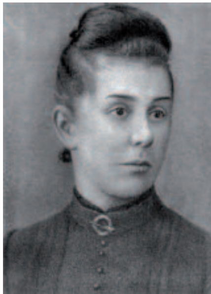
А.Н.Турчанинова Фотография

Isaac LEVITAN ▶ Autumn. Estate. (Autumn. Dacha). 1894 Pastel on paper 48 × 63 cm Vrubel Museum of Fine Arts, Omsk