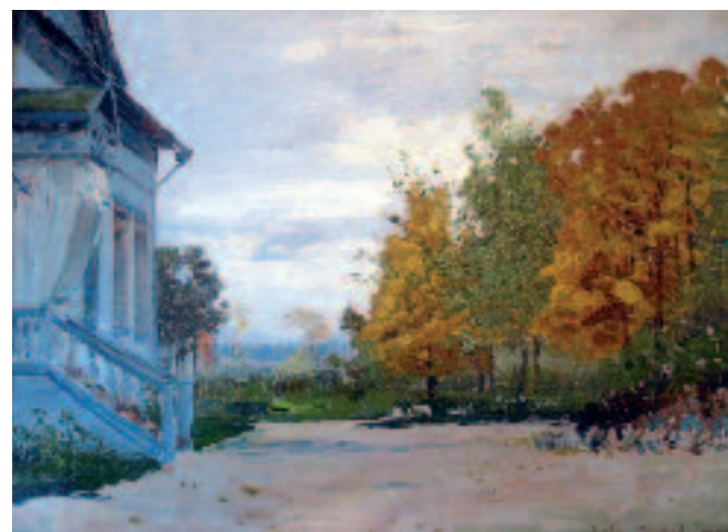
▼ Isaac LEVITAN Babkino. The Kiselevs' House . 1885 Anton Chekhov Museum, Yalta