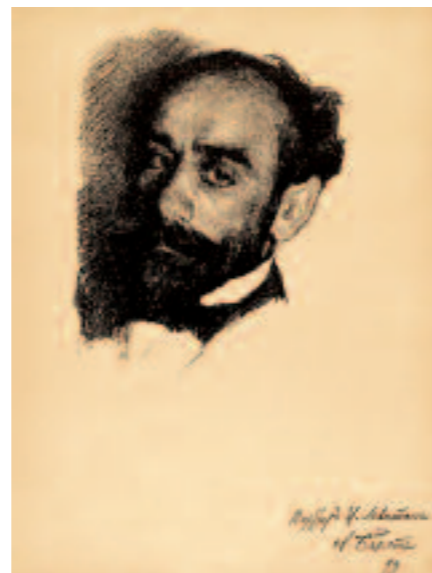
Л.С.БАКСТ ▶ Портрет И.И.Левитана 1899 Литография

Levitan left after his death about 40 unfinished paintings and 300 sketches. The monumental painting “Lake” (Russian Museum), on which Levitan worked in 1899–1900, remained unfinished. The artist’s last piece was “Hay-making” (Tretyakov Gallery).