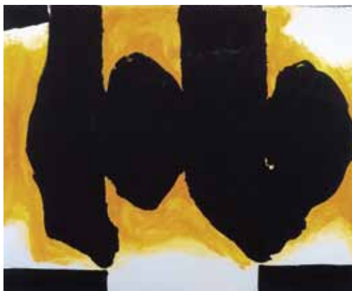
РОБЕРТ МАЗЕРВЕЛЛ. ОБЖИГАЮЩАЯ ЭЛЕГИЯ. 1991. ЛИТОГРАФИЯ. 197 X 132 ROBERT MOTHERWELL. BURNING ELEGY, 1991. LITHOGRAPHY. 197 X 132 CM

Юхана Кристиана Дала (1788 – 1857) часто называют отцом норвежской живописи. Действительно, именно благодаря ему в начале XIX века норвежская живопись приобрела национальные черты, а заложенная им традиция оказала значительное влияние на дальнейшее развитие изобразительного искусства в Норвегии. В своих художественных поисках Дал сочетал героизированное изображение природы с натуралистическим подходом к искусству, заложив тем самым основы тесной связи норвежского искусства с природой и ландшафтом страны. Искусство с тех пор развивалось и видоизменялось, однако первостепенная значимость изображения природы на протяжении многих лет – да и вплоть до наших дней – была и остается характерной для многих норвежских художников.