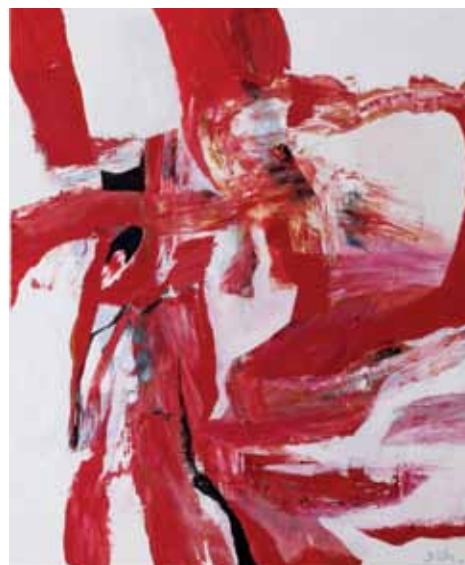
ИНГЕР СИТТЕР. КРАСНОЕ. 2007. ХОЛСТ, АКРИЛ. 160 X 130 INGER SITTER. RED. 2007. ACRYL ON CANVAS. 160 X 130 CM

Not least because of its roots in the Romantic period with its mystification of the Nordic landscapes, Norwegian art was for many foreigners associated first and foremost with depictions of landscapes and natural phenomena such as changes in light and dramatic seasonal scenes. Countless exhibitions are arranged and numerous publications released on this subject both nationally and internationally, and titles like "Northern Light" and "The Mystic North" have become almost