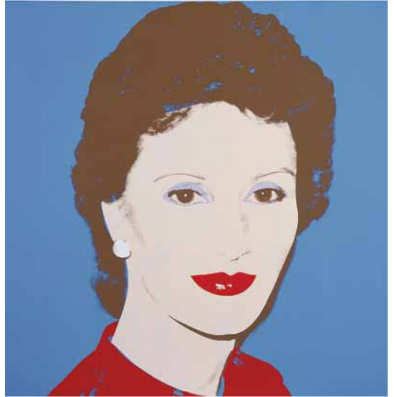
ЭНДИ УОРХОЛ. СЕРИЯ «ЗНАМЕНИТОСТИ». КРОНПРИНЦЕССА СОНЯ. 1982. ХОЛСТ, ШЕЛКОГРАФИЯ, ПОЛИМЕРЫ. 102 X 102 / ANDY WARHOL. CELEBRITIES. CROWN PRINCESS SONJA. 1982. SILK PRINT AND POLYMER ON CANVAS, 102 X 102 CM