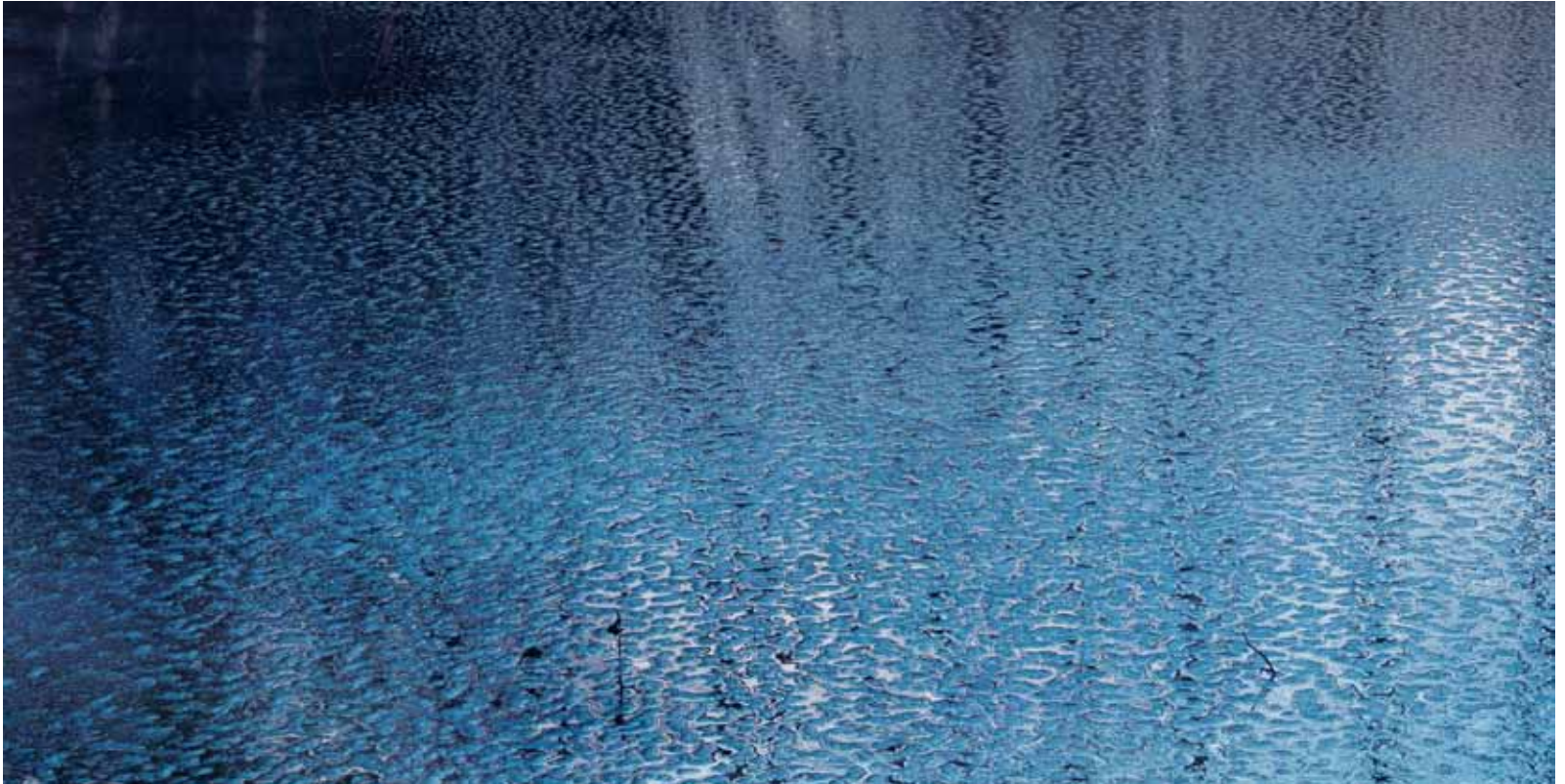
АКСЕЛЬ ХЮТТЕ. КРАЙ ЗЕМЛИ. НОРВЕГИЯ. 1999. ФОТОГРАФИЯ. 156,5 X 236,5 / AXEL HUTTE. VERDENS ENDE. NORWAY. 1999. PHOTOGRAPHY. 156.5 X 236.5 CM

ты покупать, и приобретала их либо непосредственно в мастерских у художников, либо на больших и малых выставках как в Норвегии, так и за ее пределами. Некоторые работы дарили ей, а с другими королева расставалась, даря их членам семьи.