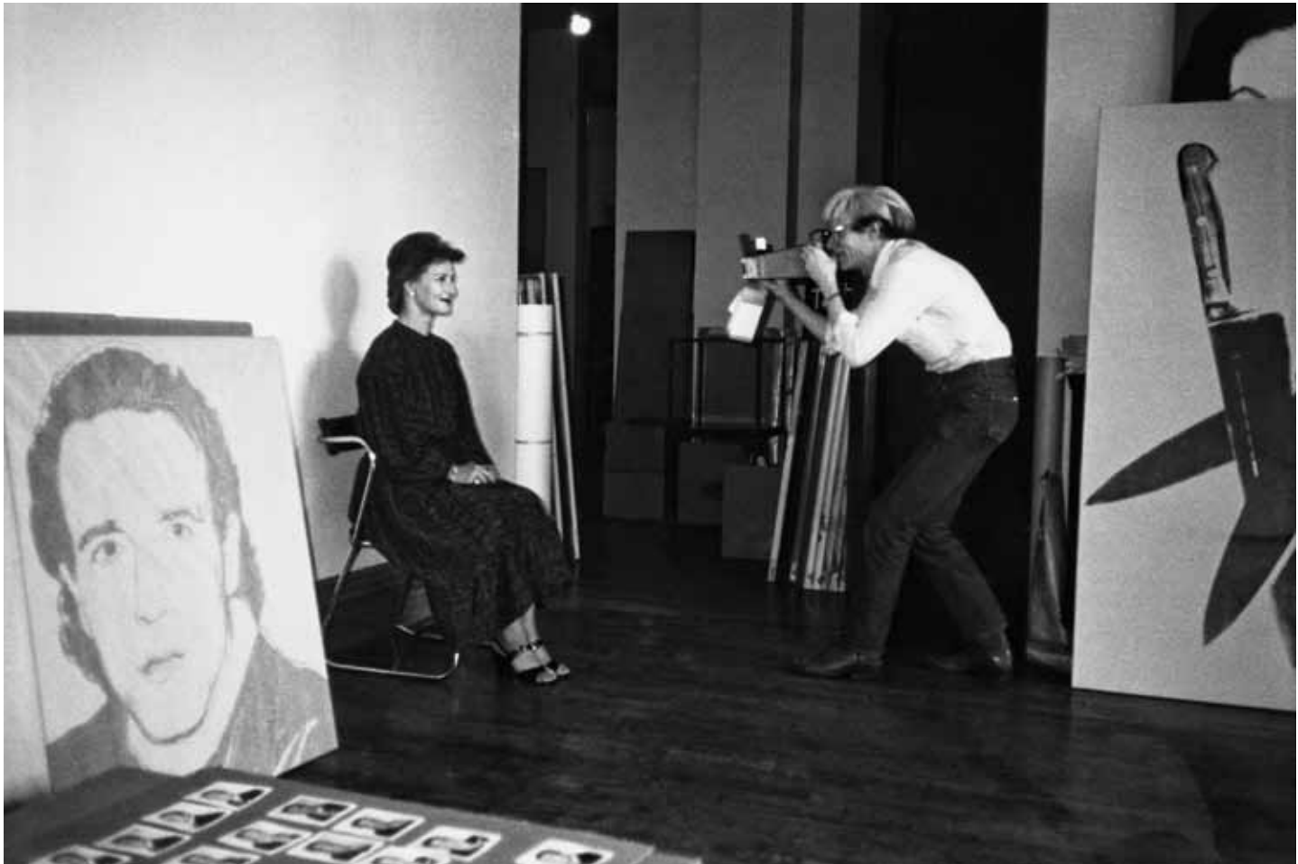
КРОНПРИНЦЕССА СОНЯ И ЭНДИ УОРХОЛ В СТУДИИ «ФАБРИКА». 15 СЕНТЯБРЯ 1982 Г. / CROWN PRINCESS SONJA AND ANDY WARHOL IN «THE FACTORY». SEPTEMBER 15 1982