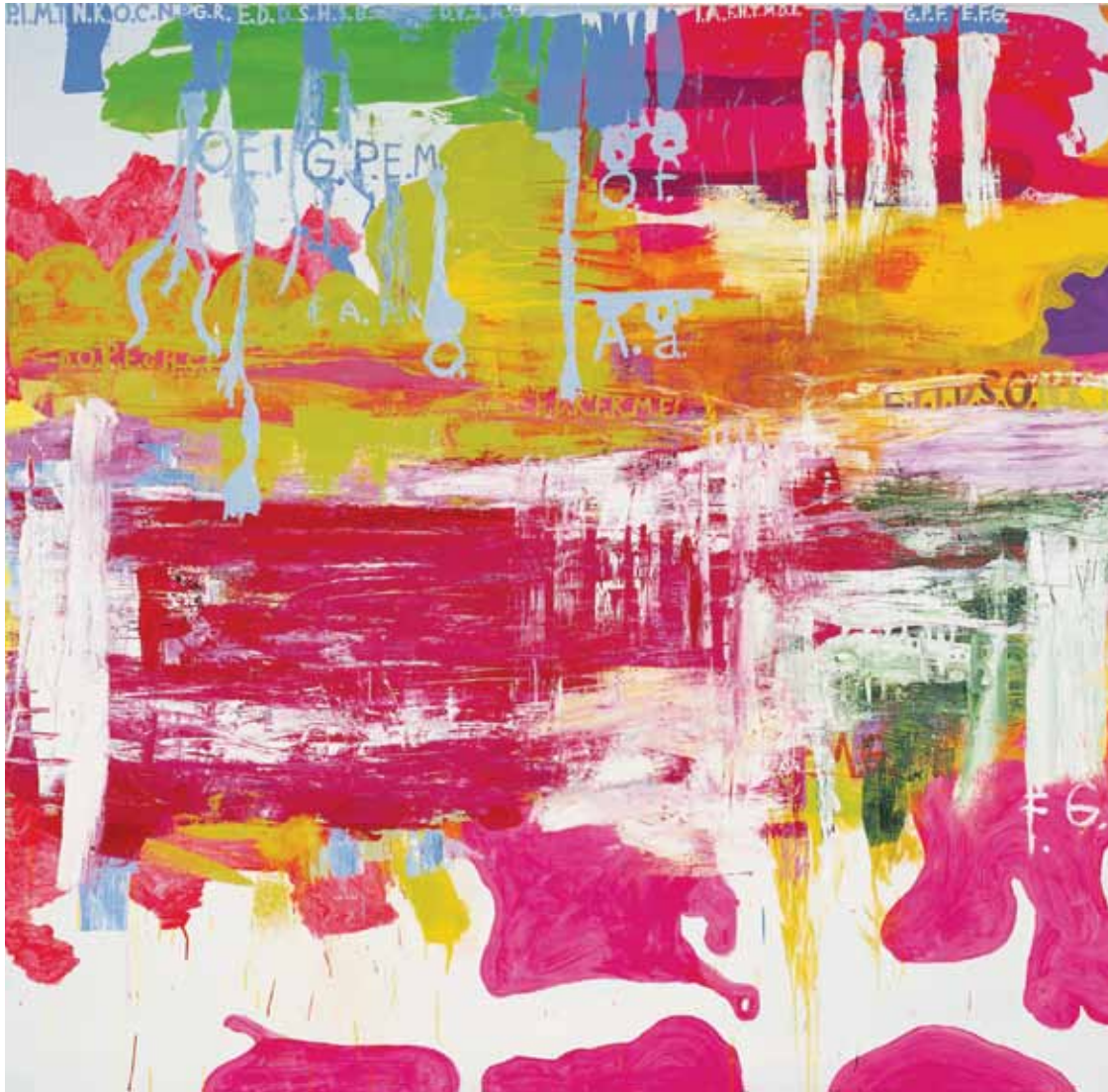
УЛАВ КРИСТОФФЕР ЙЕНССЕН. ПАЛОНДОМ II. 2000. ХОЛСТ, АКРИЛ, МАСЛО. 302 X 312,5 OLAV CHRISTOFFER JENSSSEN. PALONDOME II. 2000. ACRYL AND OIL ON CANVAS. 302 X 312.5 CM