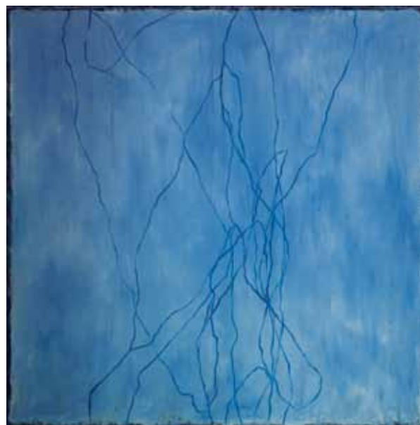
БЬЁРН СИГУРД ТУФТА. НЕ УХОДИ! 2007. ХОЛСТ, МАСЛО. 200 X 201 BJØRN SIGURD TUFTA. DON'T LEAVE. 2007. OIL ON CANVAS. 200 X 201 CM