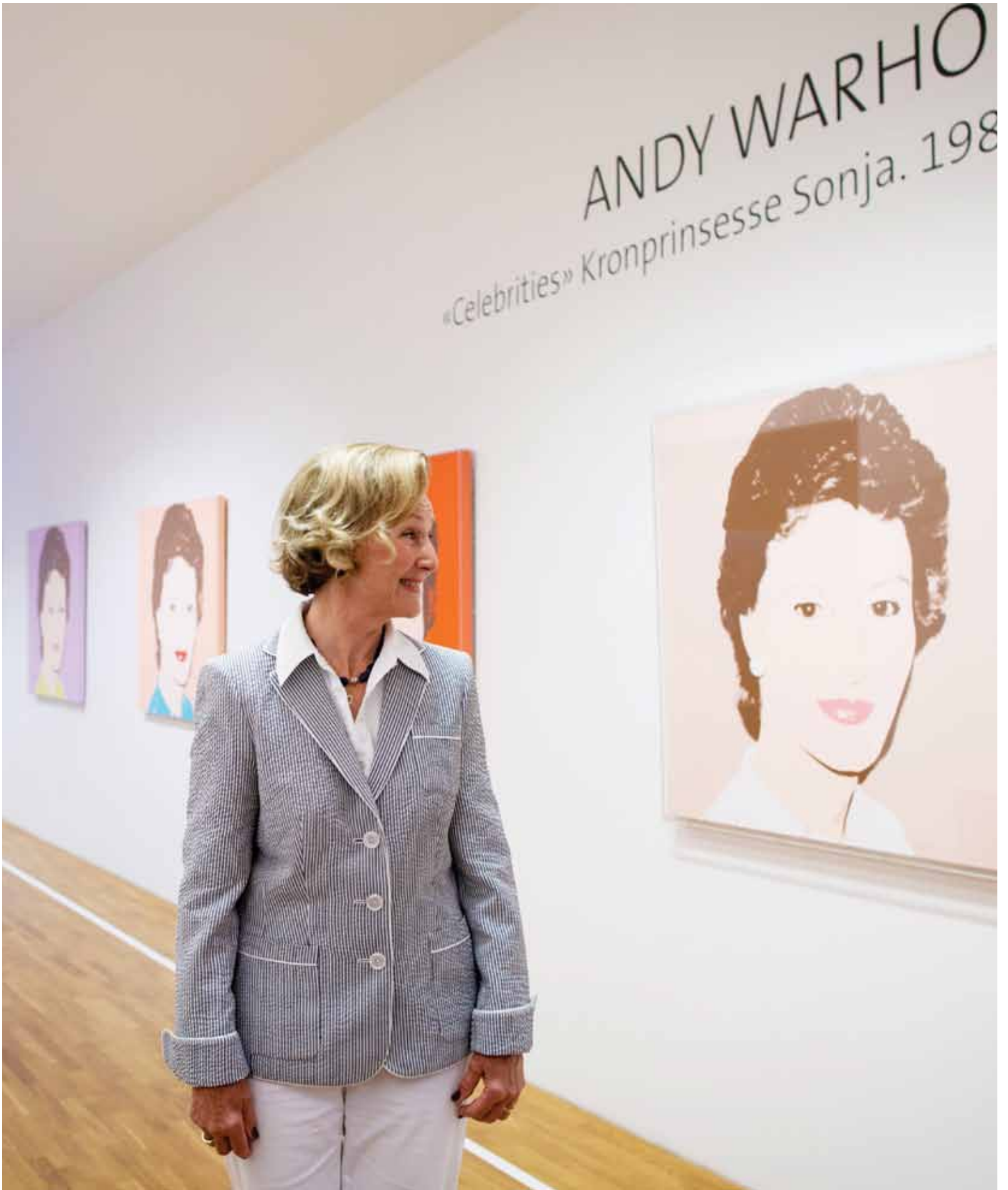
ЕЕ ВЕЛИЧЕСТВО КОРОЛЕВА СОНЯ. ЦЕНТР ХЕНИ-УНСТАД. 2012 / H.M. QUEEN SONJA AT THE HENIE ONSTAD ART CENTRE, 2012