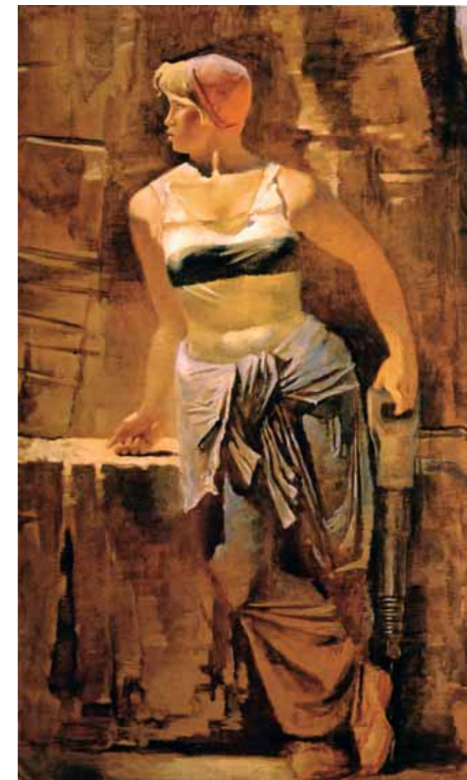
А.Н.САМОХВАЛОВ Метростройка со сверлом. 1937 Холст, масло 205×130