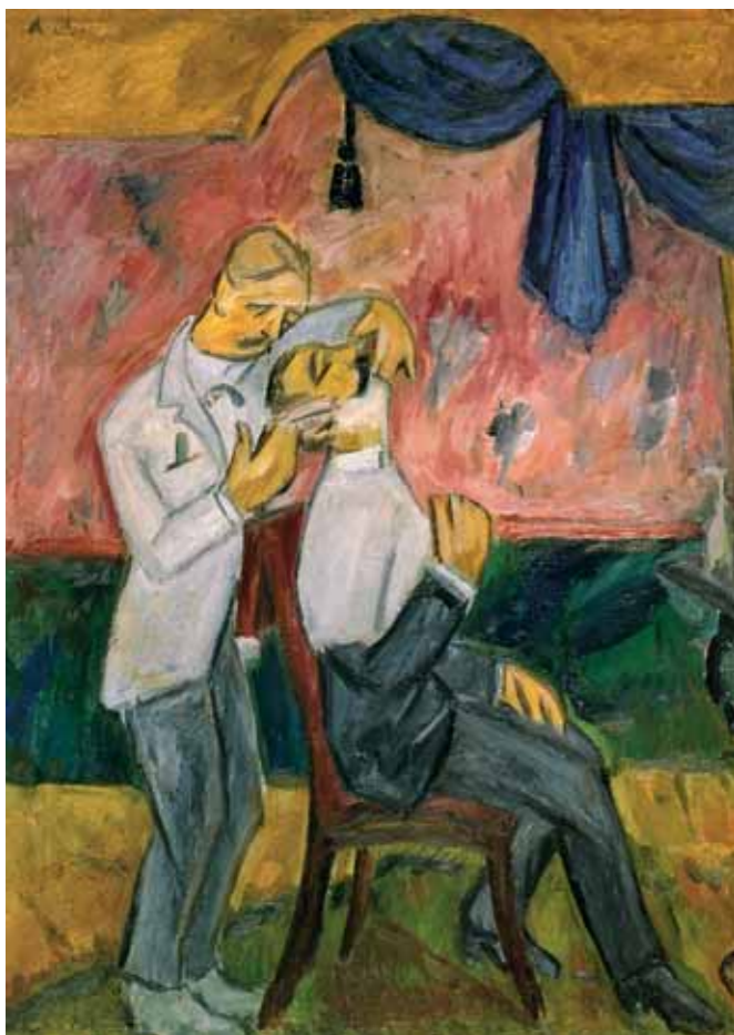
М.Ф.ЛАРИОНОВ Парикмахер. 1907 Холст, масло 77,5×59,5