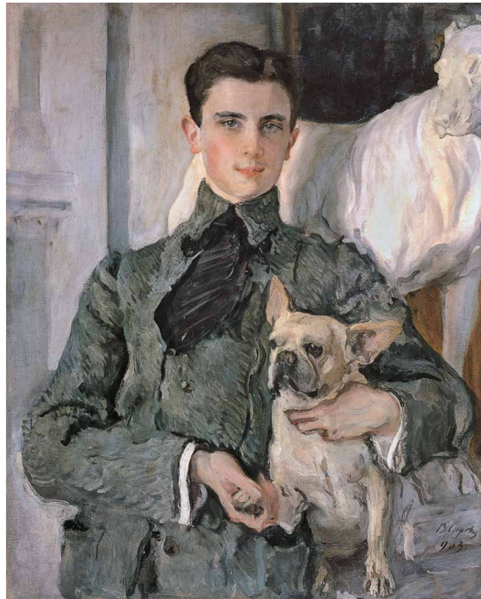
Valentin SEROV ▶ Portrait of Count Felix Sumarokov-Elston, later Prince Yusupov 1903 Oil on canvas 89×71.5 cm