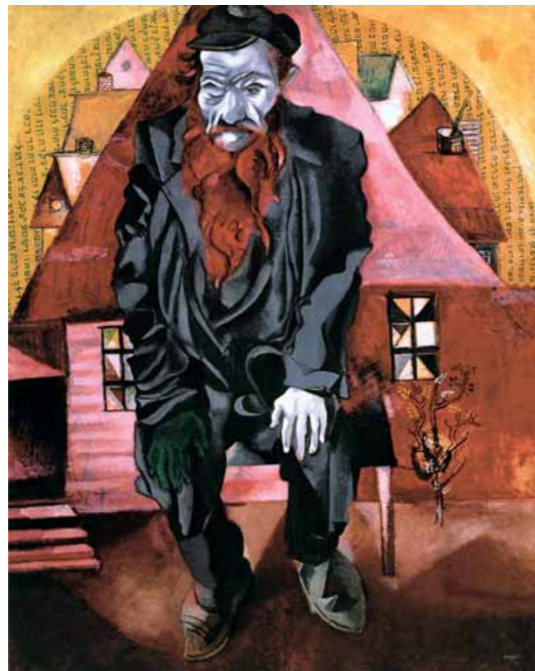
М.Э.ШАГАЛ Еврей в красном. 1915 Картон, масло 100×80,5