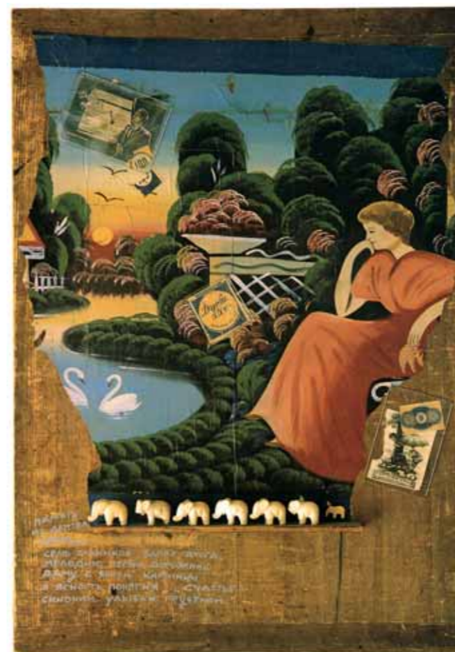
В.С.ВОИНОВ Россия – родина слонов. 1983–1985 По мотивам рассказа А.И.Солженицына «Один день Ивана Денисовича» Доска, масло, коллаж. 100×74