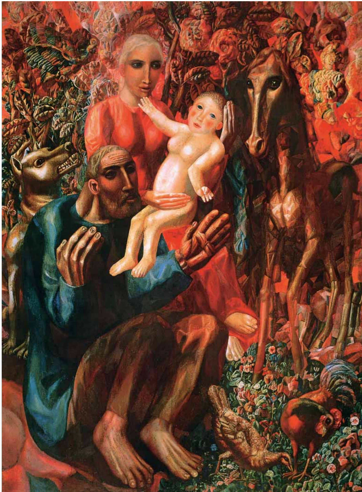
◀ П.Н.ФИЛОНОВ Крестьянская семья (Святое семейство) 1914 Холст, масло 159×128