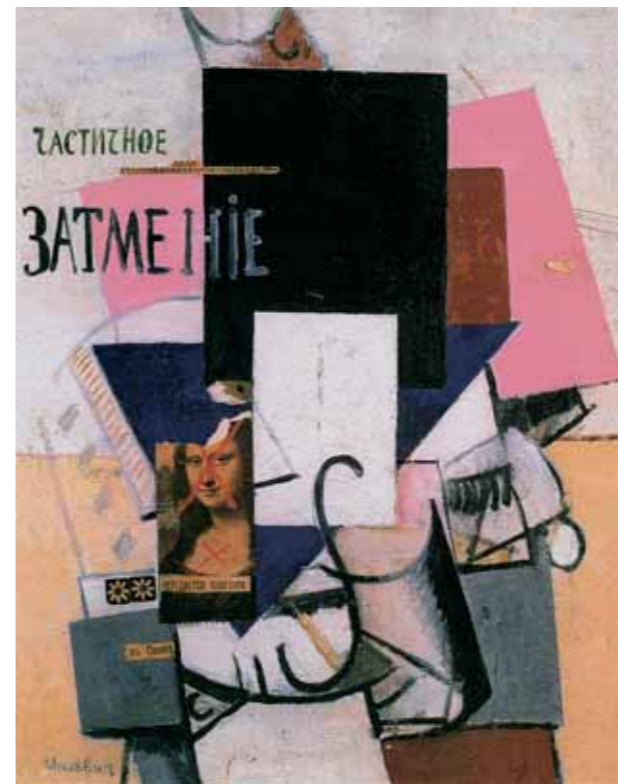
К.С.МАЛЕВИЧ Частичное затмение. Композиция с Монай Лизой. 1914 Холст, масло, графитный карандаш, коллаж 62×49,5

“During the years when the most prominent realist painters of the bygone 19th century, such as Ilya Repin, Vasily Surikov and Viktor Vasnetsov, continued to work, Russian national art ‘at an accelerated pace’ covered the distance, pursuing artistic quest and experiencing the struggle of trends along the way, from Impressionism and native Romantic experiments, through Neo-Primitivism and Cubo-Futurim, to Rayonism, Abstract Expressionism, Suprematism, and Neo-Classicism. That was the age of the earthshaking exhibitions of the ‘World of Art’, the Union of Artists, ‘Blue Rose’, ‘Knave of Diamonds’, ‘Donkey’s Tail’, ‘Target’, ‘0, 10’, which often caused scandal and, along with it, the publication of collective and individual manifestos, and public debates. In the late 1900s and 1910s Russian cul-