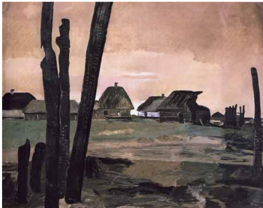
А.А.ДЕЙНЕКА Сгоревшая деревня. 1942 Холст, масло 100×125