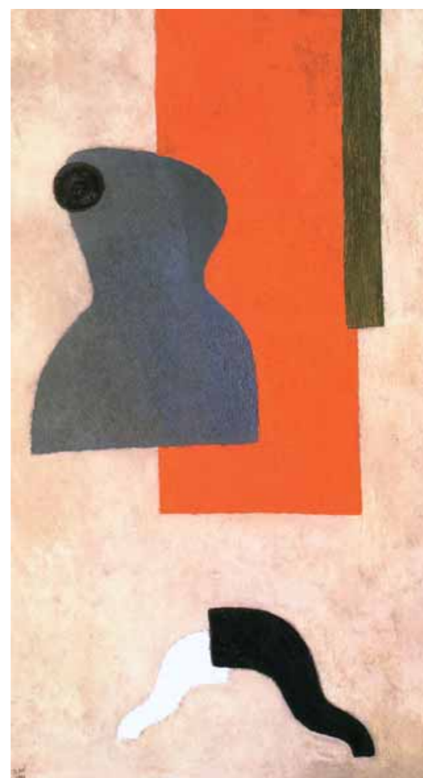
В.В.ЛЕБЕДЕВ Кубизм № 1 (Манекен). 1921 Холст, масло 120×67