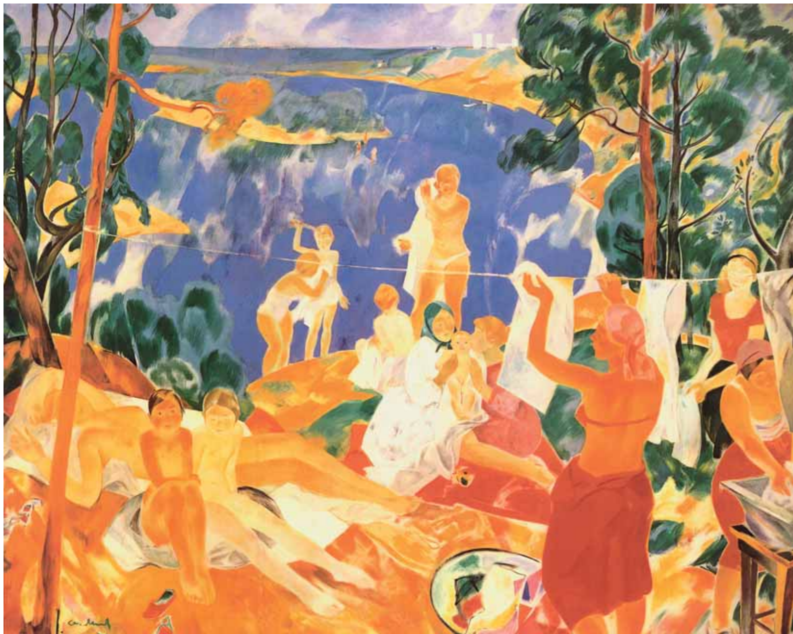
А.А.МЫЛЬНИКОВ Лето. 1970 Холст, темпера 200×250