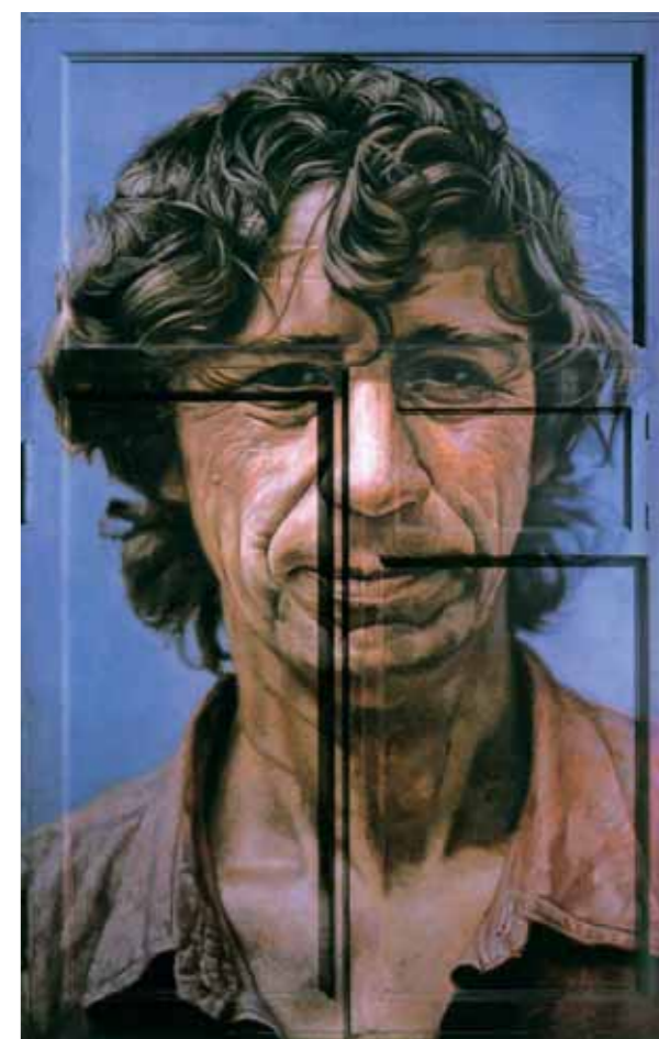
Igor MAKAREVICH Portrait of Ivan Chuiikov. 1981 Oil on wood 212×137×8 cm