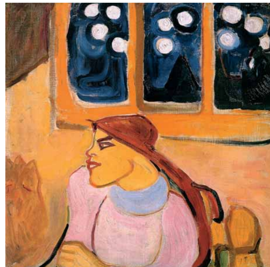
◀ Wassily KANDINSKY Improvisation. 1910 Oil on canvas 97.5×106.5 cm

к юбилейному альбому отмечается, что начало XX столетия «в сознании русских людей ассоциируется с понятием Серебряного века. По интенсивности поисков, охвативших все сферы отечественной культуры, по яркости достижений, определивших дальнейшее развитие национального искусства, по талантливости плеяды творцов – философов, литераторов, художников, архитекторов, музыкантов и актеров – этот период сравним только с Золотым веком начала XIX столетия, с эпохой Пушкина. В изобразительном искусстве, как и в других сферах национальной культуры, Серебряный век отмечен страстным устремлением художников к положительному идеалу и интенсивными поисками новых средств выразительности, попытками реформировать традиционный изобразительный язык. Этот период связан с высшими достижениями Серова, Врубеля, Коровина, Нестерова, Малявина, Рериха, Кустодиева, Петрова-Водкина, Серебряковой, Б. Григорьева, А. Яковлева, Трубецкого, Голубкиной, Коненкова. В годы, когда продолжали плодотворно работать виднейшие реалисты ушедшего XIX века – Репин, Суриков и Васнецов, отечественное искусство прошло