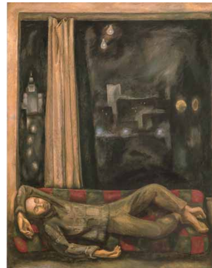
Viktor POPKOV Work Is Over. 1970 Tempera and oil on canvas. 200×160 cm