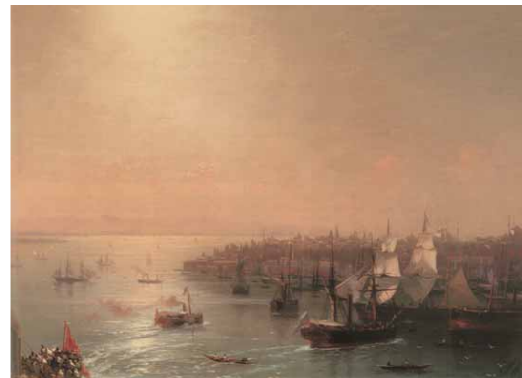
IVAN AIVAZOVSKY Arrival of a Russian ship in Constantinople. 1880. Oil on canvas