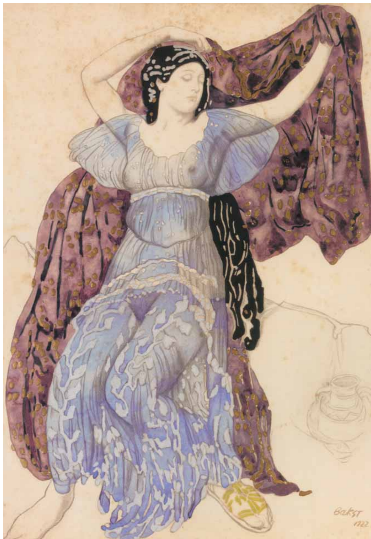
ЛЕВ БАКСТ Эхо непринужденности 1922 Бумага, акварель, карандаш, покрытие золотом и серебром