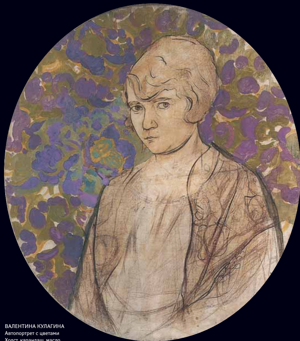
ВАЛЕНТИНА КУЛАГИНА Автопортрет с цветами Холст, карандаш, масло