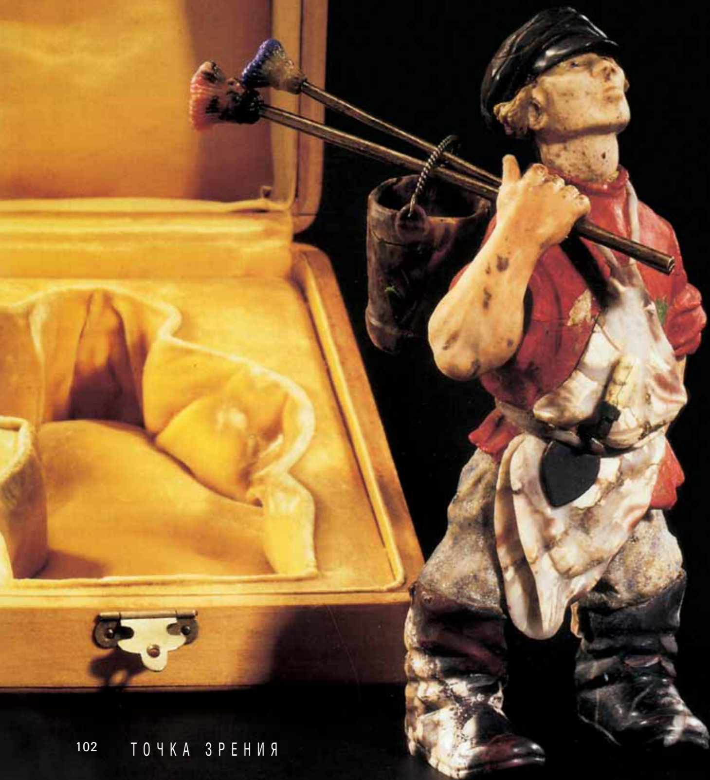
БОРИС ФРЕДМАН-КЛУЗЕЛЬ Модель фигурки уличного маляра для фирмы «Фаберже» 1916 Резьба по камню

«Sotheby's» и «Christie's» организовали аукционы русского искусства в традиционный для них срок в конце ноября в Лондоне. Как обычно, «Sotheby's» проводил аукцион в две сессии. Живопись и графика продавались 19 ноября 2003 г. на Нью-Бонд Стрит, 34–35, аукцион скульптуры, декоративно-прикладного искусства и печатной графики с добавлением некоторых работ второй половины XX века проходил на следующий день в «Олимпии». «Christie's» объединил продажу русского искусства и произведений декоративно-прикладных из серебра (XVI–XX вв.), но провел аукцион в основном помещении на Кинг-Стрит, 8, а не на «дочернем» на Южном Кенсингтоне, где проходят малозначимые торги, к которым в последние годы был отнесен и аукцион русского искусства.