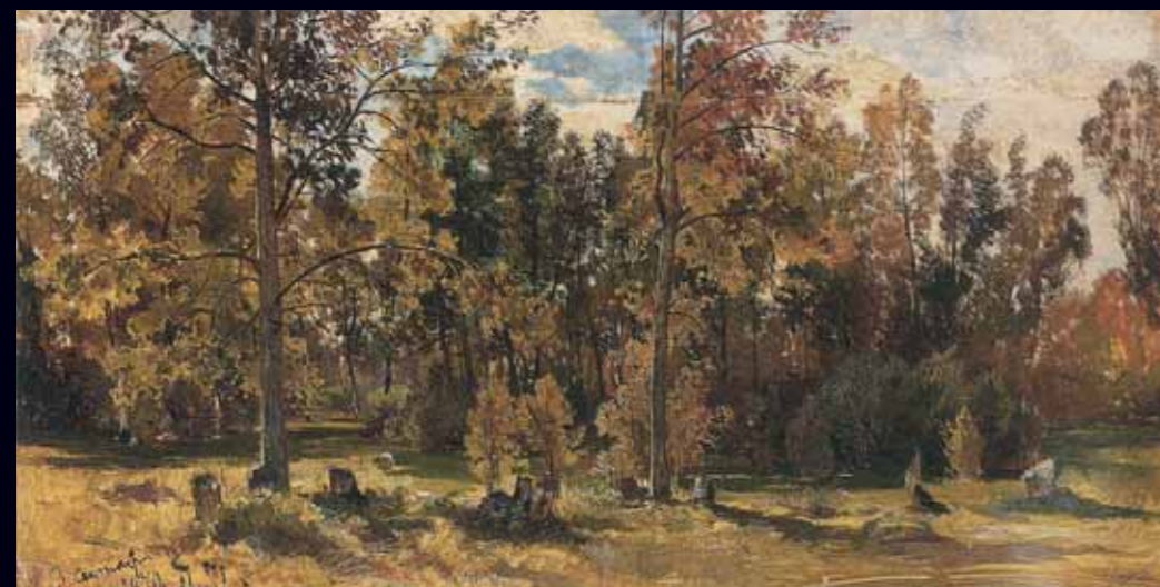
ИВАН ШИШКИН Этюд лесной поляны летом. 1870 Бумага, наклеенная на картон, масло