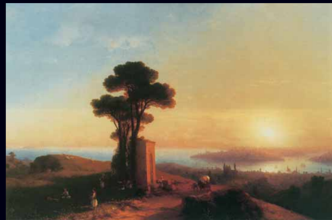
ИВАН АЙВАЗОВСКИЙ Вид Константинополя 1852 Холст, масло

Участников интересовали прежде всего многочисленные произведения «лидера» русской антиварной живописи Ивана Айвазовского, широко представлен-