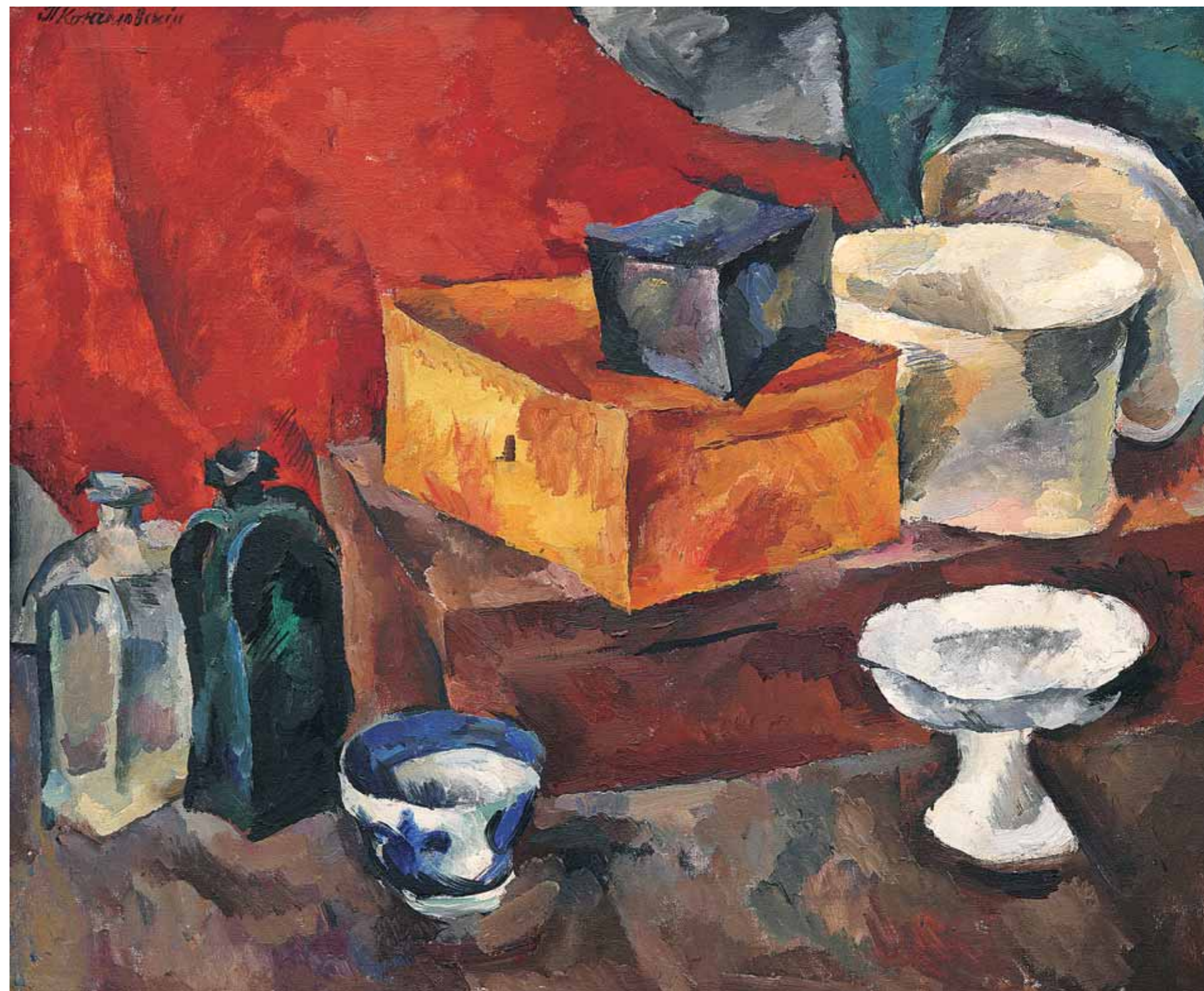
КОНЧАЛОВСКИЙ П.П. Натюрморт. 1911 Холст, масло. 107×132 Pyotr P. KONCHALOVSKY Still Life. 1911 Oil on canvas. 107 by 132

The noble and patriotically motivated efforts of P.M. Tretyakov, aimed at the establishment of a free-to-all Russian art gallery, evoked an impressive response from the public and served as an example for his followers. After Moscow, museums soon became popular in the provinces. In 1881, A.P. Bogolyubov (the grandson of the late-18th century writer A.N. Radishchev) submitted to the Minister of the Emperor's Court I.I. Vorontsov-Dashkov a project for the establishment of art museums in every Russian provincial city and university centre: the renowned artist insisted that it was a matter of state importance to carry out his project. He recalled the Western European tradition, saying that "every obscure town has a museum in the town hall, which city dwellers are happy to visit and contribute to". It was due to the efforts of Bogolyubov and his supporters that one of the first provincial art museums was opened in 1885 in Saratov. It was followed by several more art museums and art departments at museums in