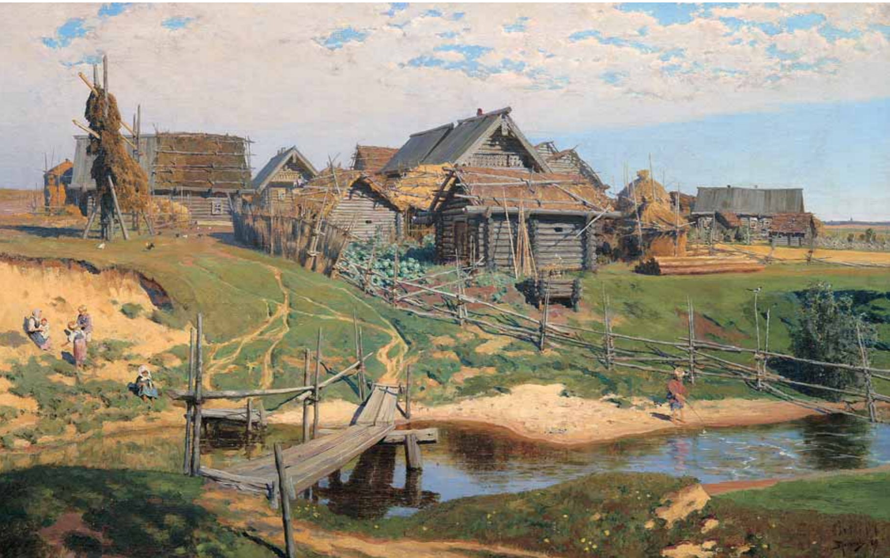
ПОЛЕНОВ В.Д. Русская деревня. 1889 Холст, масло. 89×142 Vasily D. POLENOV Russian Village. 1889 Oil on canvas. 89 by 142

любители искусства (К.П.Головкин, И.П.Пожалостин, В.П.Сукачев), представители интеллигенции, в том числе А.П.Чехов, органы городского самоуправления. Основу провинциальных собраний составляли дары частных лиц; картины, присылавшиеся из Академии художеств; произведения, поступавшие от авторов, а также от коллекционеров Москвы и Петербурга.