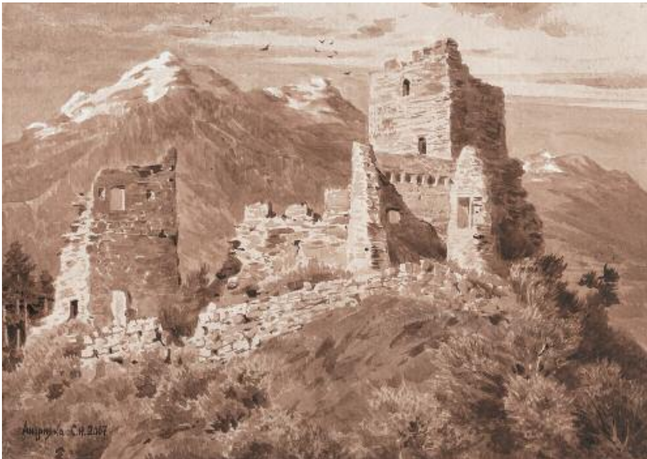
Сергей АНДРИЯКА Австрия. Замок Кинбург. 2007 Гризайль 37,5 × 54,5